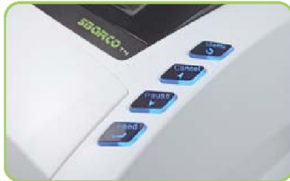
多功能按鍵 + 閃燈警示