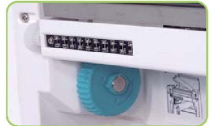
排列式穿透感應器 (自動感測)